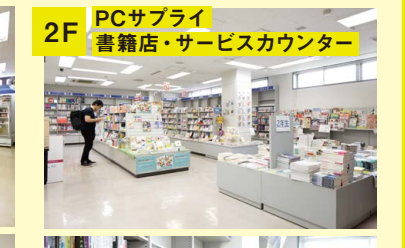
2F PCサブライ 書籍店・サービスカウンター