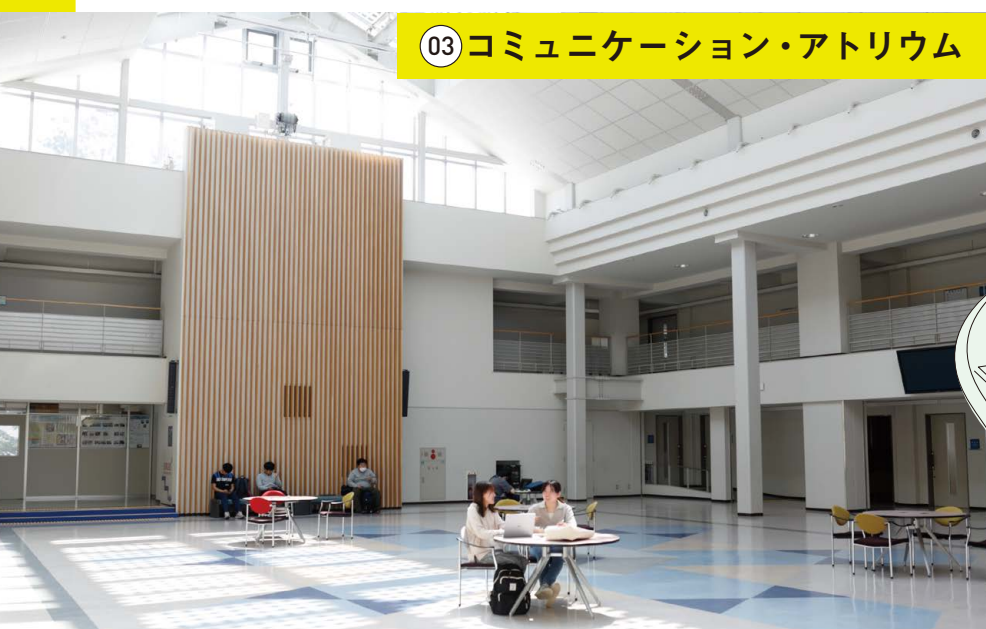
03 コミュニケーション・アトリウム